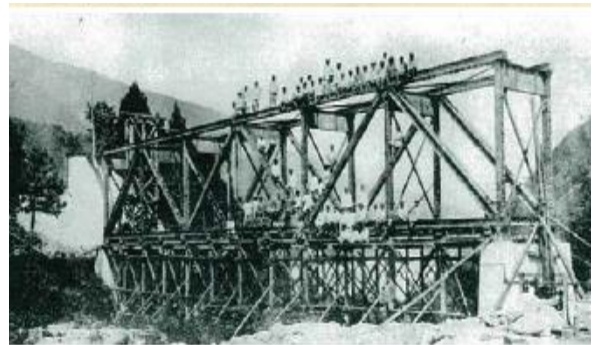
宇奈月谷橋梁で記念撮影する千葉鉄道連隊