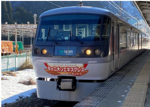
キャニオンエクスプレス(20020 形) ・電鉄黒部駅7:58発に乗車いたします。

1922 年(大正 12 年)11 月 21 日に黒部鉄道(現・地鉄本線の黒部市区間)の省線三日市駅(現在の黒部駅)・桃原駅(現在の富山地方鉄道本線宇奈月温泉駅及び黒部峡谷鉄道宇奈月駅)間全線で、富山県内初の鉄道線電車の運転が開始されました。黒部のまちづくりに影響を与え、産業・文化発展の礎となった鉄道の歴史や技術を振り返るとともに、次世代に向けて、鉄道まちづくりを考える機会を提供すべく、「歩く鐵道展」を開催いたします。