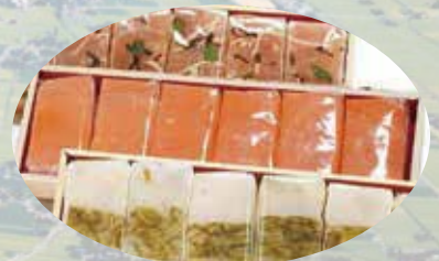
ブラタモリで紹介！押し寿司